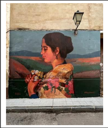
(Medina de las Torres, Badajoz, 1999)

Graduado en Bellas Artes por la Universidad Politécnica de Valencia y Máster en Producción Artística. Artista multidisciplinar, desarrolla su trabajo en función del proyecto y su contexto, siendo la pintura el grueso de su práctica artística. Sus intereses recaen en la memoria del territorio, la cultura local y los recuerdos de la infancia, enfocados a través del imaginario tradicional y de la experiencia personal.