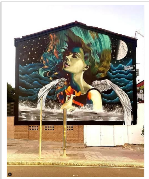
(Llerena, Badajoz. 2000)

Comenzó a pintar graffiti a los 12 años, realizó estudios de bachillerato artístico y continuó su formación de manera autodidacta, realizando murales en países como Brasil, Polonia o Alemania.